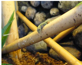
Figuur 2. Vrouw