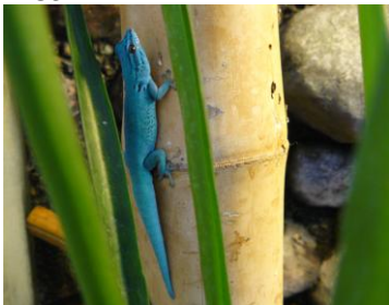
Figuur 1. Man

Het geslachtsonderscheid is niet puur door de kleur te bepalen. Wanneer de omstandigheden in het terrarium niet optimaal zijn (te koud, te droog) dan kunnen ook mannen een groen/bruine kleur hebben, waardoor ze erg op de vrouwen lijken. Mannen kun je herkennen aan een verdikte staartwortel en pre-anaalporiën. Vrouwen hebben dit niet.