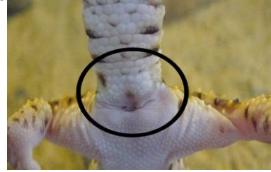
Figuur 2. Vrouw